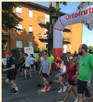
S. Michele in Bosco 2019